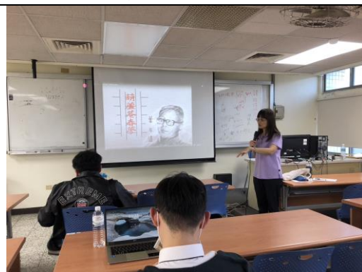
〈葫蘆巷春夢〉小說介紹