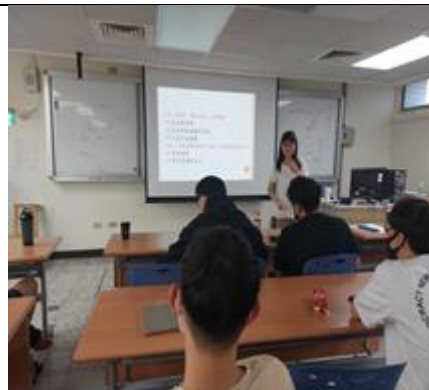
問題提出討論與分享